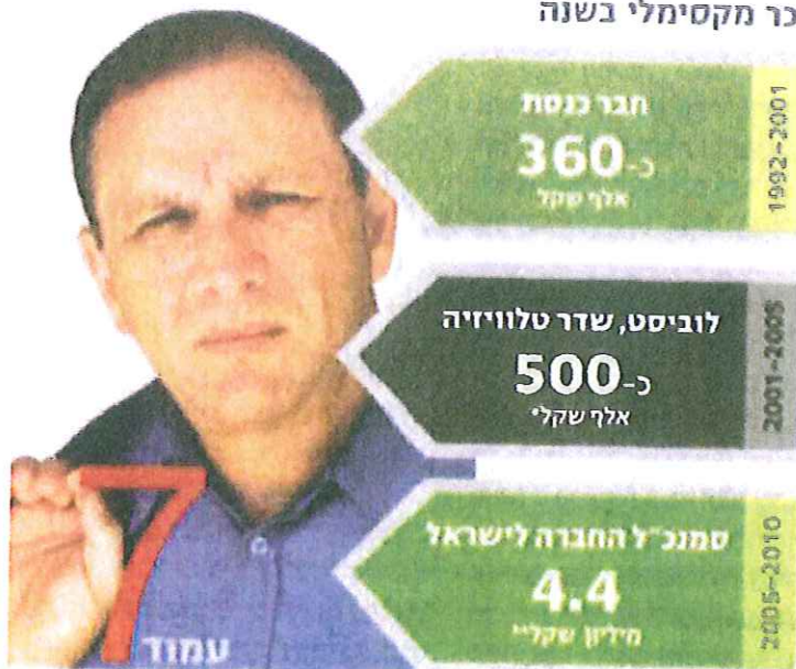
הערכה ייעולות שכר

מה מפמל שכר נבזה למשרתי ציבור לשעבר? מה המסר של השכר הזה לחד ברי כנסת מזהנים, לרגולטורים, לוביסטים ועיתונאים מצטיינים ומובשרים? למרבה הצער, המסר הוא שהכי טוב להיות כסנינה של בעלי ההון. המסר הוא שהכסף הגדול לא נמצא בצד של הציבור וטובתו, אלא בצד השני - של מי שיש לו אינטרסים כלכליים פרטיים ומחזיק בכמה ממשאבי הטבע של ישראל (כי"ל בים המלח), של מי שלא פורע את מלוא חובו לציבור (צים) ולכנסים (טאואר) ושל מי שמתכנן להשיג תלט על ענף הרכב העתידי (בטר פלייס). המסר הוא שעדיף לחצות את הקווים ולעבור להיות דוכ