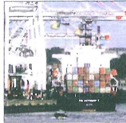
ספינת משא של חברת צים ציוסאומן. אי.י.

בזן את האבטחה הכבדה שעל האונייה, והמאבטחים הישראלים לא איבדו את עשתונותיהם וירו חזרה על התוקפים. הסירה התוקפת התקפלה, הסתובבה,